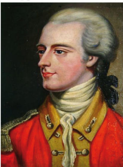
Obr. 5 Pierson "The Hero Of Jersey" (25 x 16cm)

V několika proudech Francouzi pronikli na (podle nich) klíčové místa ostrova a jen sporadicky se setkali s odporem. Přitom dosti bezohledně pobíjí nebo zraní několik civilistů. Zbláznili britské hlídky, pokud se je nemohli, a zdálo se, že hlídka britské pevnosti posádky ostrova vůbec nevidí, co se děje. Francouzi obsadili St. Helier, kolem omítnutí stěhali obřadní dům vice-gouverneura a francouzská potvora přehrápila téměř neobhájeného majora Moses Corbetta, stále vice-gouverneura a vzhledu vzhledu na ostrově, kterého odvedla do Court House (místní vládní budova a sídlo soudu) v St. Helier. Zde si utíkal de Rullecourt hlátnout stán. De Rullecourt Corbetta přemohli, že francouzi mají ostrov v rukou. Nabídl nádherné počty