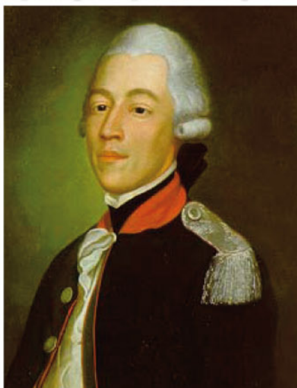
Obr. 4 Baron Philippe de Rullecourt, 1780 (neznámý autor).

Francouzi připravili nový pokus. Shromáždili expediční sbor o síle asi 2000 lidí, což bylo evidentně málo proti britské posádce 12 . A to proto, že byl údajně král Ludvík XVI akce musel vyvolat, velkou záležitost a náklady na doprava, vyžvení a zabezpečení byly značné a byly oficiálně celá akce byla považována za součásti soukromé záležitosti barona Philppa de Rullecourt (1744–1782) (obr. 4), belgicko-francouzského vojáka, který působil (podplukovník) francouzské armády a jako baron údajně sloužil, který dostal příkaz, že pokud se mu podaří obsadit Jersey, dostane hodnost generála a Comde Rouge 13 .