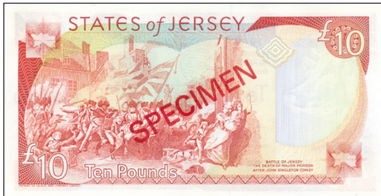
Obr. 3 Rub stávkový 10 liber The States of Jersey typ rok 1989.

spojencem válečných amerických vojáků a její kontingenty se účastnily boji především na americké půdě či na moři. Francouzi čekali války vysát nejen pro zpětné získání Kanady, ale i Normanských ostrovů, a po ústředím, že britské síly odhadly ohrožovaly americké a francouzské válečné a zásobovací loďi, hledali způsoby, jak ostrovy obsadit. Naposledy přišel 6. ledna roku 1780.