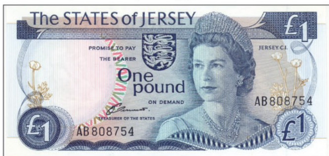
Obr. 1 Líc stávkový 1 libra The States of Jersey typ rok 1976.

Líc platidla není nijak dojemný – kompozice portrétu a blatouchu – typická produkce obchodní ceninové tiskárny TDLR 3 . Za povšimnutí stojí jen portrét britské královny Alžběty II. 4 s tiarou (obr. 1). Opravdu vynikající podobiznu mladé královny vyryl pravděpodobně Stanley Doubtfire 5 podle fotografie Anthony Buckleyho. Platidlo navrhl Brian James White (viz Lit. [1]).